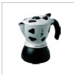
2004 VIUKKA EXPRES