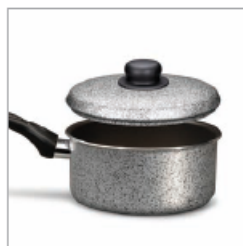
1980 LINEA TRUD