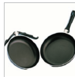
1998 SPAZIO SYSTEM