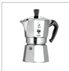
1933 MOKA EXPRES

n. 443939 del R.E.A. presso C.C.I.A.A. di BRESCIA